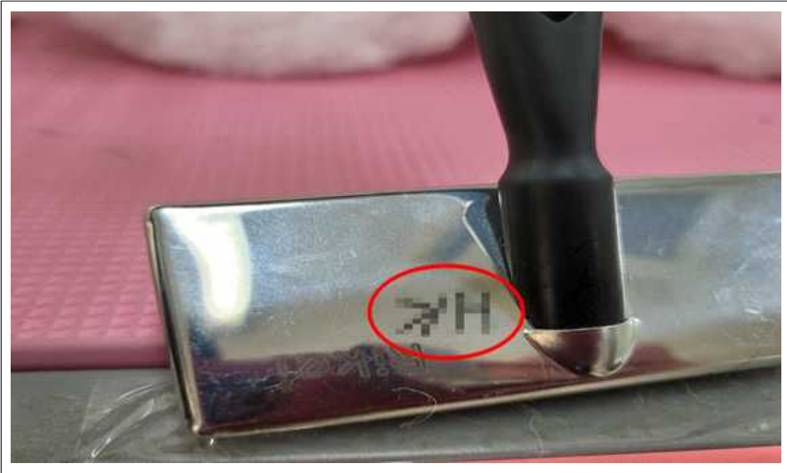
(사진설명) 슬리커에 이니셜 표시