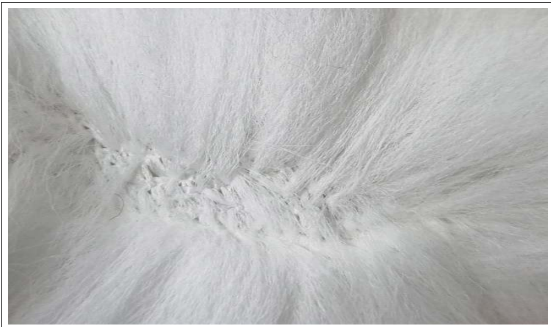
(사진설명) 위그털이 말려들어감