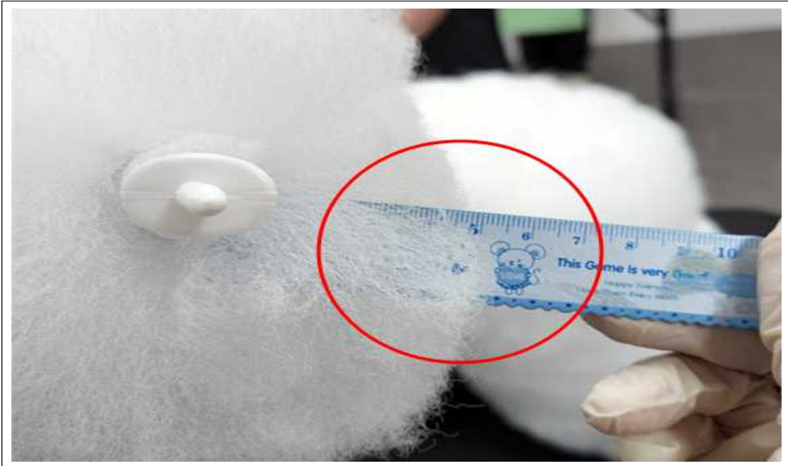
(사진설명) 꼬리털 길이가 7cm 기준에 미달