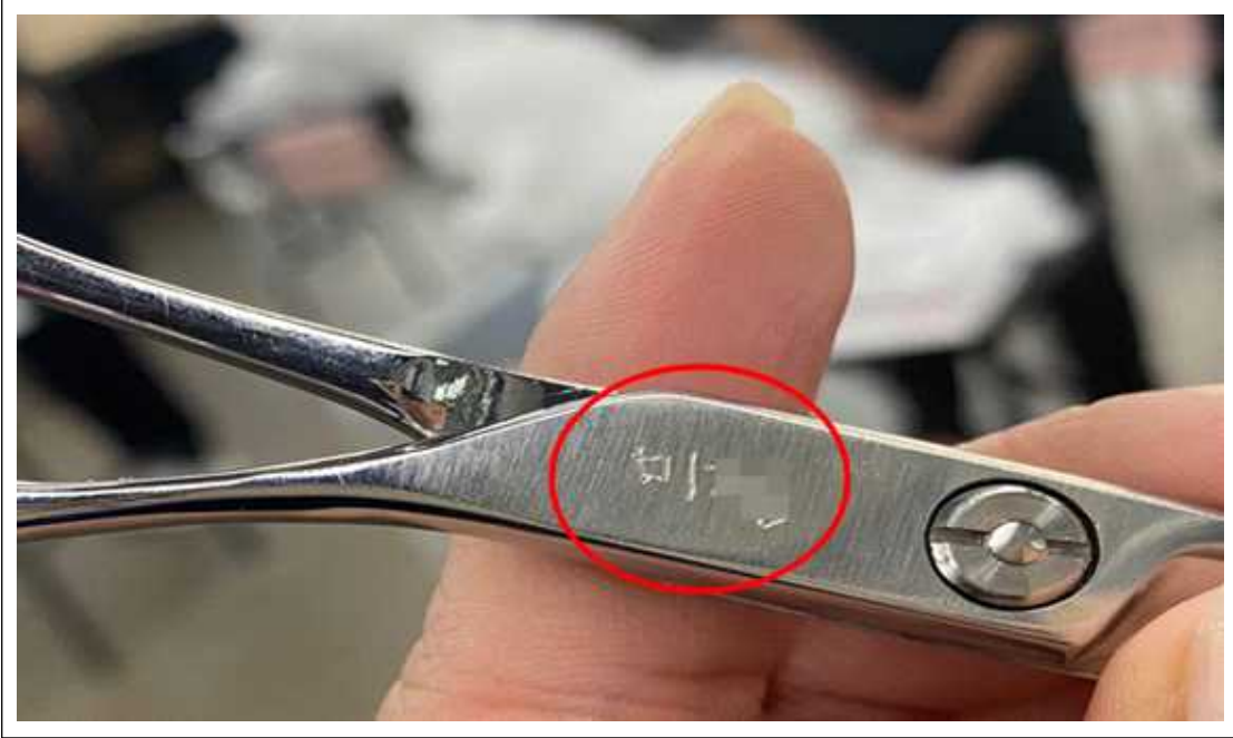
(사진설명) 가위에 이름 새김