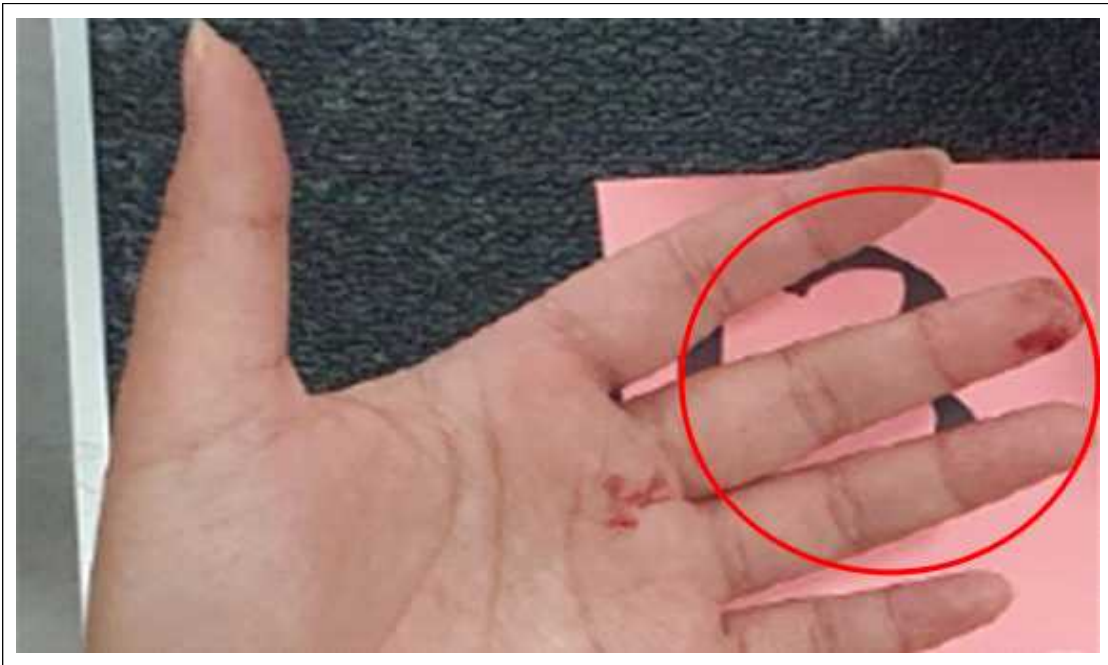
(사진설명) 작업 중 수험자 상해