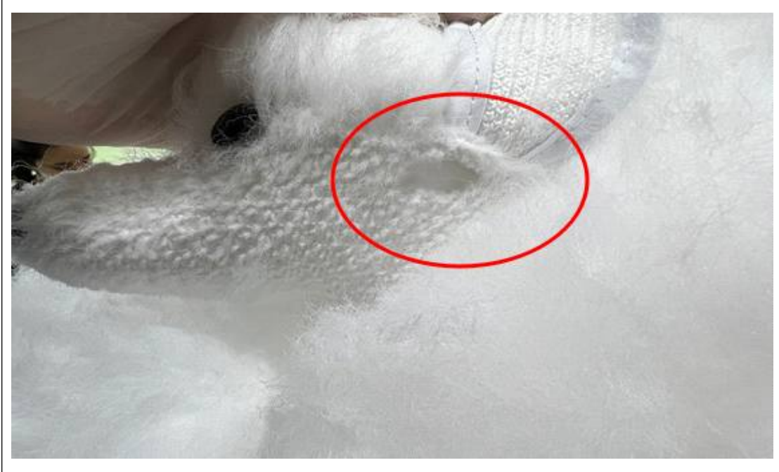
(사진설명) 작업 중 위그 훼손